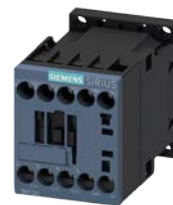
Motorstarter koordinasjon – Direkte startende motor – Type 2 koordinasjon – Klasse 10 – 150kA@400V